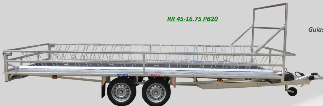
RR 45-16.75 PB20

Incluye: Guías para CRUZ (Bike-Rack G) de acero lacado CON antirrobo Rueda de Repuesto Rueda Jockey