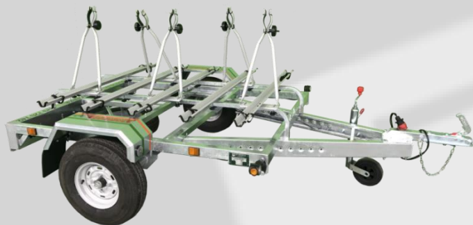
R 17-13.50 PB5

En los de dos ejes, pasillo central Mayor comodidad en carga y descarga